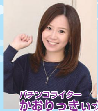
パチンコライター かわりっきい☆