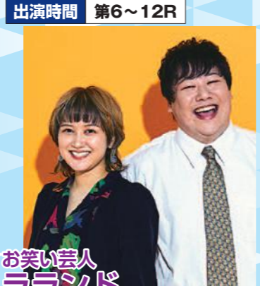
お笑い芸人 ララランド