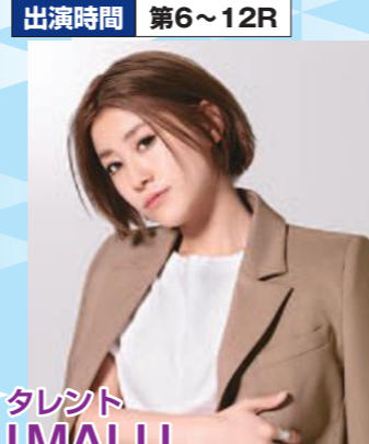
タレント I MALU